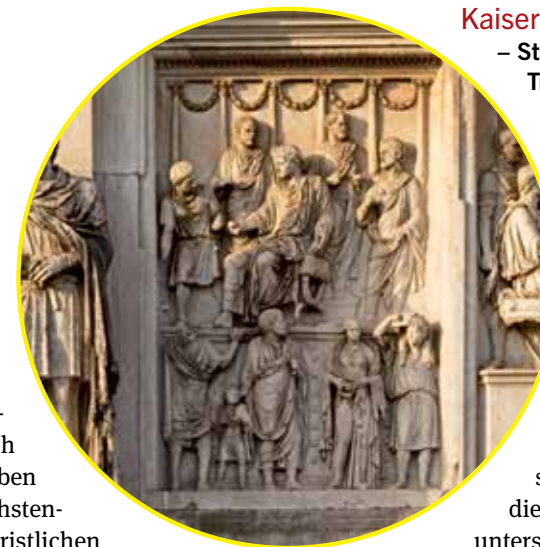
Kaiser Konstantin verteilt Geldgeschenke (Pfeil) – Stilisierung des Kaisers als Wohltäter auf dem Triumphbogen, den der Senat im Jahr 315 für ihn in Rom errichten lässt. Bei seinem Regierungsantritt erkaufte sich Konstantin hier als „Euergetes“ eher die Sympathien der Reichen. Später wird er als erster Kaiser die Versorgungseinrichtungen der christlichen Gemeinden für Arme finanzieren.

Mit diesen einleitenden Bemerkungen soll keineswegs behauptet werden, dass es kirchlich organisierte Nächstenliebe vor Konstantin nicht gegeben hat. Sie war aber in der Regel an einzelne Personen wie die Witwen – die nämlich nicht nur Versorgungsempfängerinnen waren, sondern auch die Aufgabe hatten, Bedrängte zu versorgen oder Gefangene zu besuchen – und Diakone oder insbesondere ab dem 3. Jh. auch an die Diakoninnen (griech. diakonissa ) und vor allem an den Bischof gebunden. Am Bischofsitz befand sich auch die Gemeindekasse, aus der Arme und Bedürftige Unterstützung finden konnten, die sogenannten deposita pietatis , das heißt so viel wie die „Einlagen der Frömmigkeit“.